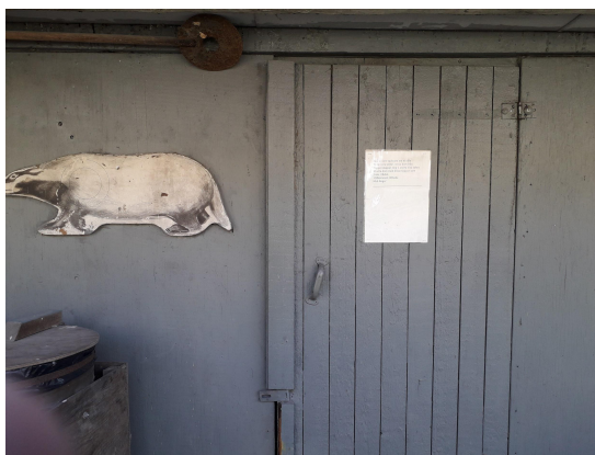
Målboden i markörgravnen på 80m